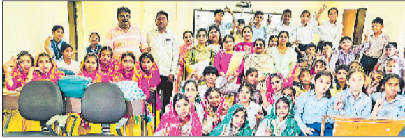
गुहला चीका। प्रतियोगिता के दौरान प्रतिभागी छात्रों और शिक्षक समूह।

कार्यक्रम का मुख्य उद्देश्य विद्यार्थियों को अपनी प्रतिभा प्रदर्शित करने के लिए मंच प्रदान करना तथा उनमें कला और संस्कृति के प्रति रुचि विकसित करना रहा। फोक ड्रास प्रतियोगिता में छात्राओं ने हरियाणवी संस्कृति की सुंदर झलक प्रस्तुत की। रंग-बिरंगे पारंपरिक परिधानों, बेहतर तालमेल