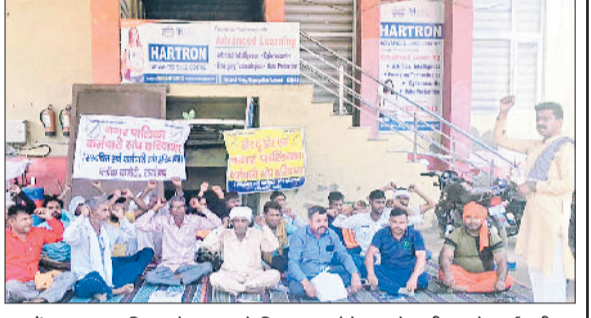
राजौड़। नगर पालिका गेट पर छठे दिन धरना देते व नारेबाजी करते कर्मचारी।