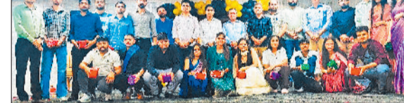
कैथल। विदाई पार्टी के दौरान स्टाफ सदस्य तथा विद्यार्थी।