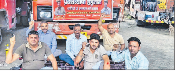
गुहा-चीका। अग्निशमन विभाग के कर्मचारी 29वें दिन भी हड़ताल पर उठे रहे, मांगों के समर्थन में फायर स्टेशन परिसर में प्रदर्शन करते हुए।

» शहीदों के परिवार को एक सरकारी नौकरी व एक-एक करोड़ के मुआवजे की मांग