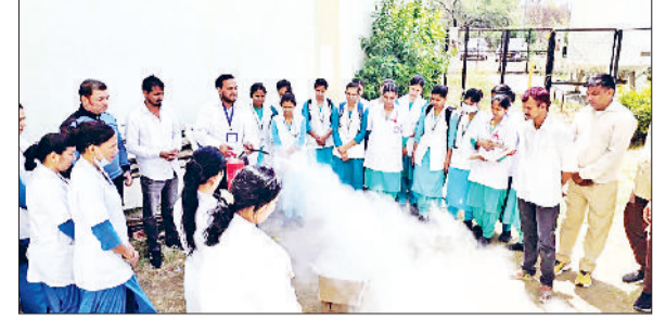
जीद। आग बुझाने का डेमो करते स्वास्थ्य अधिकारी।