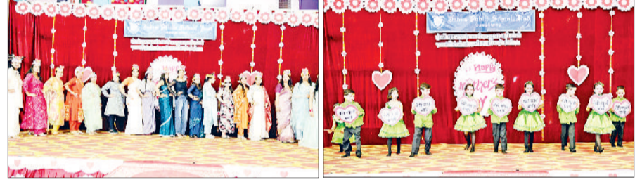
अवादी रहा। जिसमें माताओं ने पूरे आत्मविश्वास के साथ भाग लिया। उन्होंने आकर्षक परिधानों में रैप वॉक कर अपनी प्रतिभा और व्यक्तित्व का शानदार प्रदर्शन किया। कार्यक्रम में कई सरप्राइज प्वायंटस भी रखे गए। जिनसे पूरे