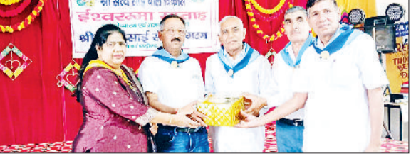
जीद। कार्यक्रम में मुख्यातिथियों को सम्मानित करते हुए।

श्री सत्य साई सेवा संगठन हरियाणा एवं चंडीगढ़ जिला जीद द्वारा स्थानीय एसपी मेमोरियल पब्लिक स्कूल में ईश्वरम्मा जन्म दिवस पर श्लोकोच्चारण व भजन प्रतियोगिता का आयोजन किया गया। जिसमें हैप्पी सीनियर सेकेंडरी स्कूल जीद, एसपी मेमोरियल पब्लिक स्कूल जीद एवं दुर्गा कॉलोनी रोहतक रोड पर संचालित बाल विकास कक्षा के 24 बच्चे ने भाग लिया। इस अवसर पर 32 लड़के, 42 लड़कियां और कुछ अभिभावक उपस्थित थे। सभी बच्चों ने श्लोक एवं मधुर भजनों के द्वारा मनमोहक प्रस्तुतियां दीं। आठ