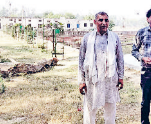
जौद। सर्व करते हुए अधिकारी।