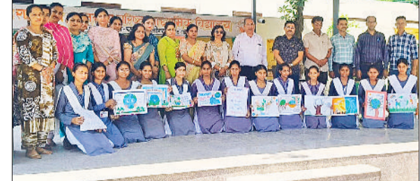
जीद। बच्चों द्वारा बनाई गई पेंटिंग।