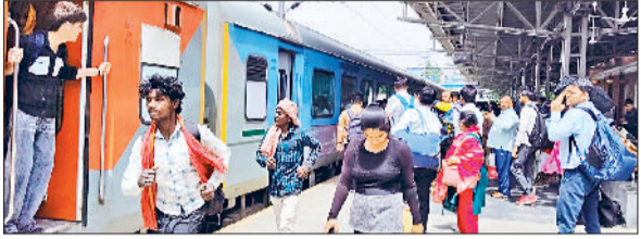
जींद। रेलवे जंक्शन पर मौजूद भीड़।

और दिल्ली जाने के लिए 35 रुपये किराया लग सकता है। ट्रैक पर मरम्मत के चलते आठ ट्रेन दिल्ली की बजाय शकूरबस्ती से लौट रही हैं। इसके अलावा पांच ट्रेनों के रूट में बदलाव किया गया है। ऐसे में ट्रेन नंबर 54031 दिल्ली-जींद ट्रेन पांच से 14 मई, 54032 जींद-दिल्ली ट्रेन