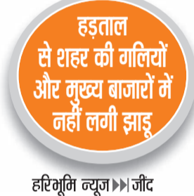
हड़ताल से शहर की गलियों और मुख्य बाजारों में नहीं लगी झाड़ू

हर रोज जींद से 100 टन से ज्यादा निकलता है कचरा